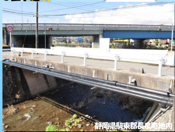
静岡県駿東郡長泉町地内